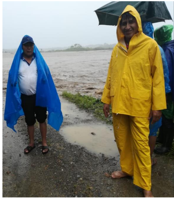
15/06/2021 Inspección de puente vehicular rio leche central morales en cual vimos que el puente necesita muros para su fortalecimiento.